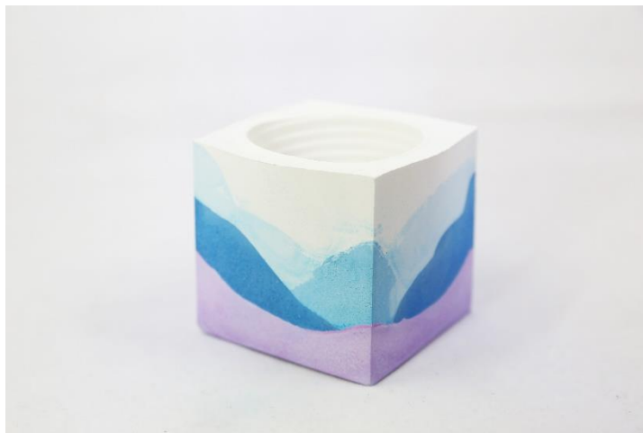
彩色四角貼模水泥盆